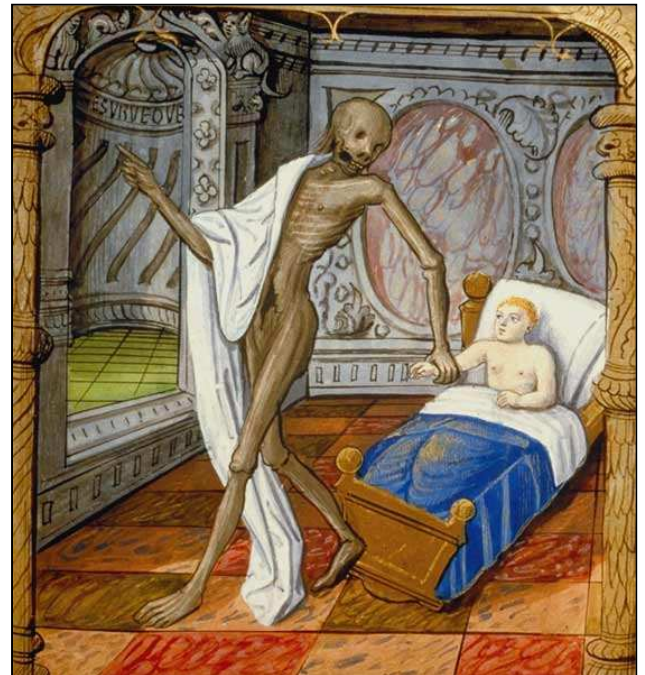
Miniature du XV e siècle, B.N.F., Paris.