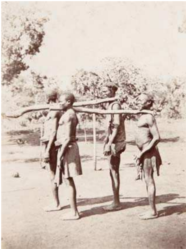
Esclaves emmenés à la fourche. Photographie de la mission Liotard