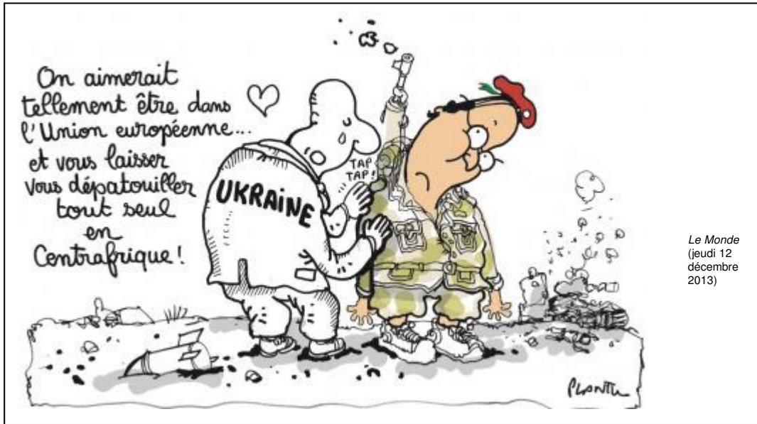
Le Monde (jeudi 12 décembre 2013)