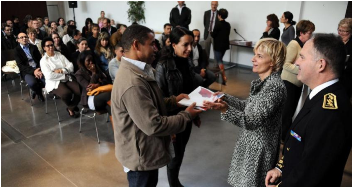
78 étrangers de 21 nationalités sont devenus français, hier, lors d'une émouvante cérémonie.

Carcassonne : « Désormais vous êtes français, on vous accueille avec chaleur ». Cérémonie solennelle de naturalisation