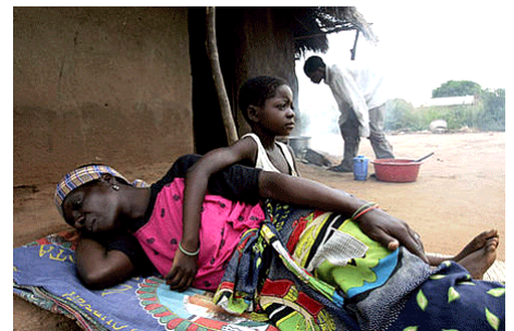
Une mère et son enfant séropositifs. Près de 12 % de la population du Mozambique est atteinte du sida

C.5.3 Lire et utiliser différents langages Lire et comprendre un document (carte ou croquis, texte, image, graphique) : en prélevant des informations pour répondre à des questions ; en résumant les idées principales dans un texte court ; en mettant en relation le document avec les connaissances.