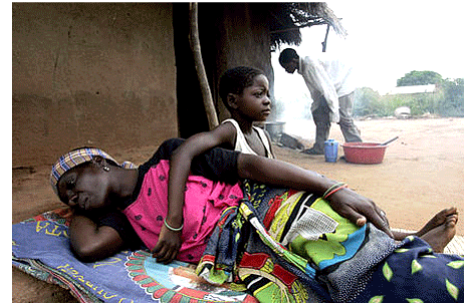
Une mère et son enfant séropositifs. Près de 12 % de la population du Mozambique est atteinte du sida

C.5.3 Lire et utiliser différents langages Lire et comprendre un document (carte ou croquis, texte, image, graphique) : en prélevant des informations pour répondre à des questions ; en résumant les idées principales dans un texte court ; en mettant en relation le document avec les connaissances.