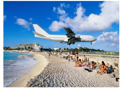
Aéroport néerlandais « Princesse Juliana » sur l'île de Saint-Martin (Antilles)