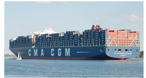
Porte-conteneurs Christophe Colomb, 365 m de long sur 52 m de large soit 3 terrains de football et demi !