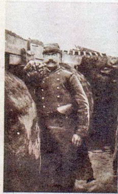
ENTRÉE D'UNE TRANCHÉE LUXUEUSE.