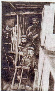
L'ÉQUIPE QUI A CREUSÉ L'ABRI