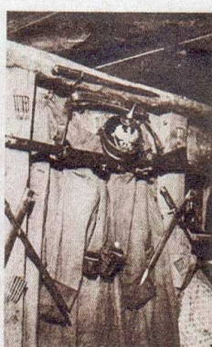
UNE PANOPLIE DÉCORATIVE

Joëlle Beurrier, Images et violences 1914-1918. Quand le Miroir racontait la Grande Guerre... , Nouveau monde, 2007