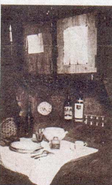
LE DÉJEUNER EST PRÊT