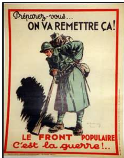
AFFICHE DE PROPAGANDE CONTRE LE FRONT POPULAIRE