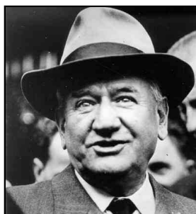
DALADIER (1884-1970) Président du Conseil de 1938 à 1940