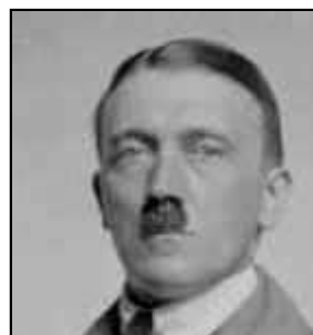
HITLER (1889-1945) Führer du III e Reich