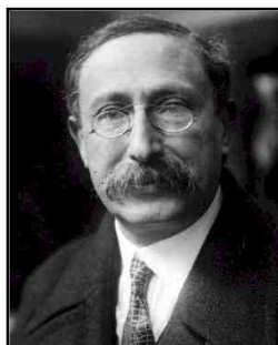
BLUM (1872-1950) Président du Conseil du gouvernement du Front populaire