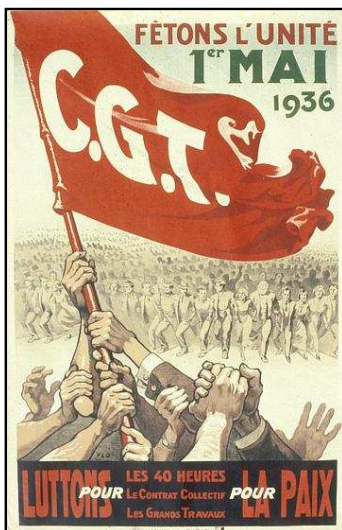
AFFICHE DE PROPAGANDE POUR LE FRONT POPULAIRE

Des affiches politiques et de propagande en France et en Allemagne