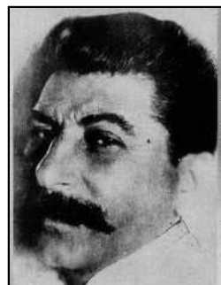
STALINE (1879-1953) Dictateur de l'U.R.S.S. de 1928 à 1953