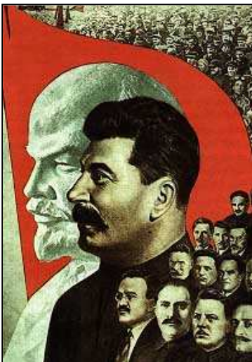
Affiche de propagande

Des affiches politiques et de propagande d'U.R.S.S.