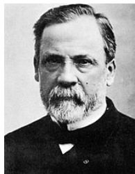
Louis Pasteur par le photographe Félix Nadar en 1878

Louis Pasteur (1822 - 1895) scientifique français, chimiste et physicien de formation, pionnier de la microbiologie, il a expliqué le principe de vaccination.