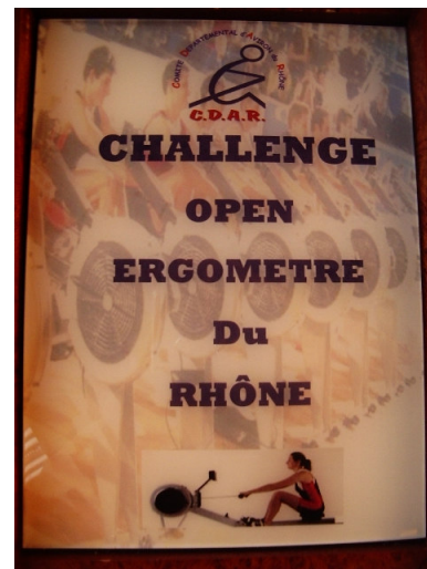
Le Challenge du CDAR

Pour cette édition 2010, aucun club ne remplissait les deux conditions. Cet appareil sera donc remis en jeu pour l'édition 2011.