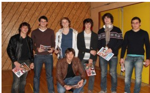
Le huit Junior du CALyon

MONTAGNE-GREFFET-LE GALLIC-BOUCHERON-ANDRE