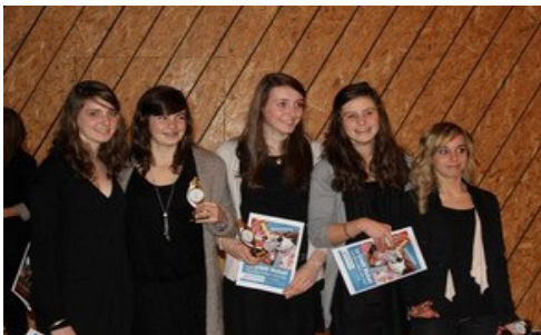
Le quatre barré de l'AUNLyon