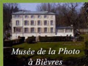
Musée de la Photo à Bièvres