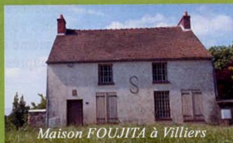
Maison FOUJITA à Villiers