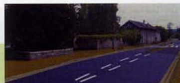
Future rue de Paris