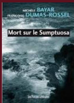
Mort sur le sumptuosa aux éditions Les presses littéraires, parution en 2013.