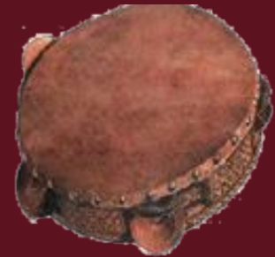
Târ : Tambour sur cadre