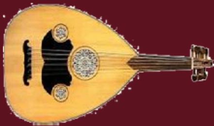
Luth : instrument à cordes pincées parallèles au manche