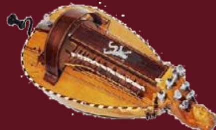
Vièle : ancêtre du Rebâb, instrument à cordes frottées