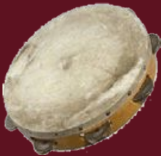
Daf : Grand tambour sur cadre, ancêtre du Târ