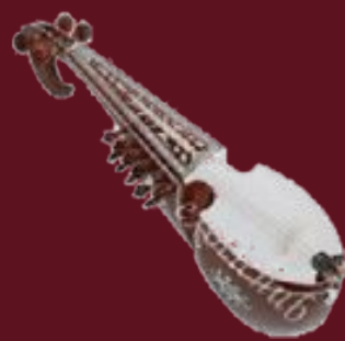
Rebâb : petit et léger, à cordes frottées