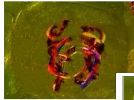
Début d'anaphase 1