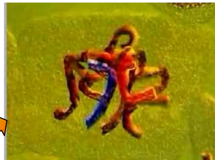
Fin de prophase 1