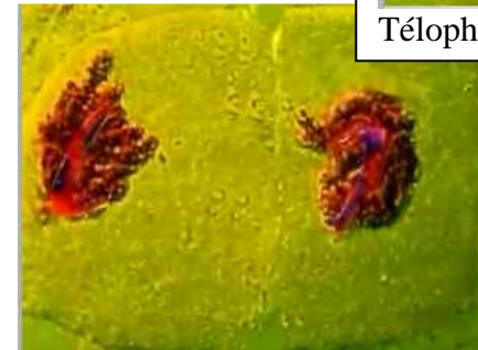
Fin de télophase 1 - début prophase2