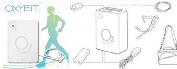
Le dispositif mis au point par une société japonaise