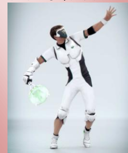
Naderer N°1 ATP