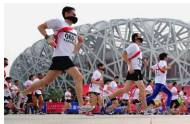
Un problème ancien; déjà en 2008, aux JO de Pékin l'air était pollué.

En effet, les prévisions météorologiques qui avaient profondément inquiété le monde sportif ces dernières semaines ont malheureusement été confirmées. Plusieurs experts ont notamment alerté les organisateurs parisiens des risques encourus lors de certaines épreuves. Le nouveau stade olympique sera exposé à des températures de 55 à 60 °C, avec des pics de gaz polluants estimés à plus de 1000 µg/m3 d'air. " Les épreuves du marathon et du 10 000m deviennent inévitablement mortelles dans ces conditions" affirme le médecin de la fédération française d'athlétisme. Rappelons que lors des championnats du monde de 2050, il y avait eu une série de malaises respiratoires et cardiaques malgré l'installation de système de réfrigération et de recyclage de l'air pollué dans la stade parisien. Enfin, c'est peut-être la mort de l'olympisme lui-même que Peter Redgrave est venu annoncer à la presse mondiale hier soir devant cette dégradation rapide des conditions de vie pour l'humanité.