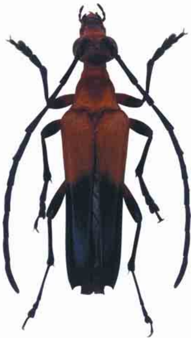
Strangalia benitoespinali (Montserrat)