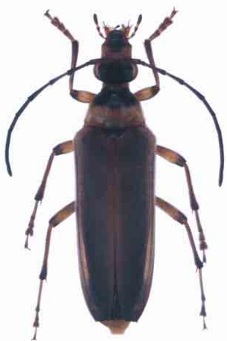
Fortuneleptura cameneni (Martinique)