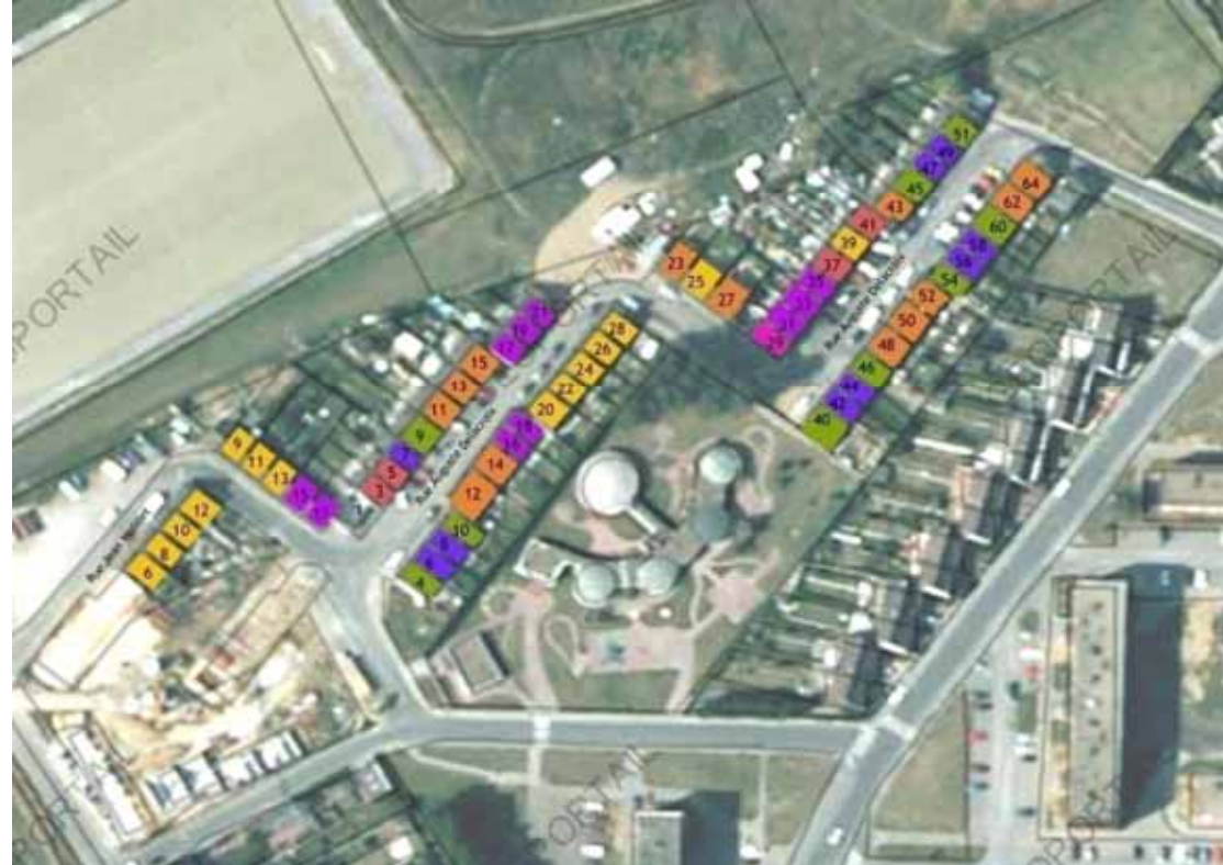
La rue Auguste Delacroix