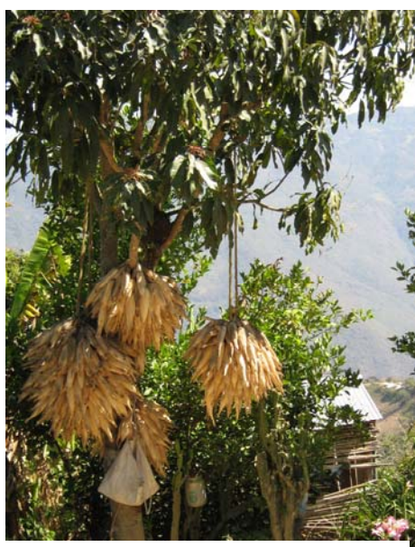
Séchage du maïs

Merci aux nouvelles technologies de communication sans qui ce travail ne pourrait avoir lieu ! En effet, le coordinateur du projet est en poste pour un projet agricole similaire à Chiouaoua, au nord du pays. La responsable mexicaine des partenariats et de la communication autour du projet vit à Oaxaca, au sud, et la coordinatrice des projets de l'association SIERRA, qui assure un rôle similaire davantage tourné vers la France, s'est installée à la capitale, Mexico, dans l'objectif de rencontrer les personnes clés pour le projet, ainsi que trouver un travail rémunéré, car même au Mexique et avec toute la bonne volonté du monde, il est impossible de travailler bénévolement pendant des années !