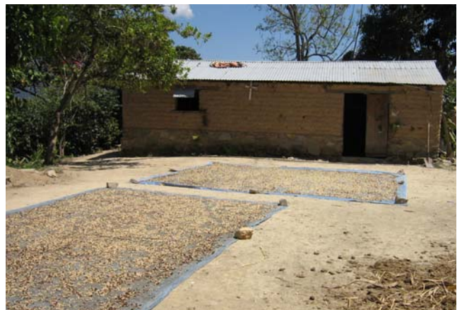
Séchage traditionnel du café