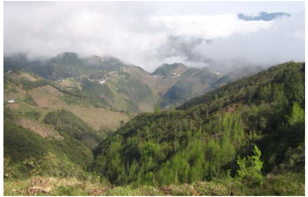
Paysages agricoles et forestiers des environs de Huautla