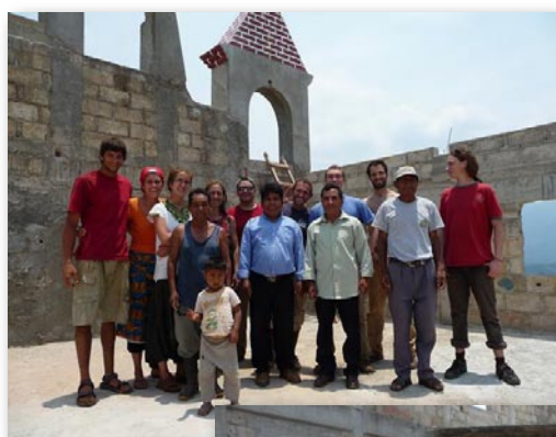
Un bon coup de main pour la construction du temple protestant du village

Le toit, rongé par la vermine, petite bestiole se nichant dans le bois et s'en nourrissant, a été entièrement refait avec l'aide de 2 ouvriers du village et suivant les techniques traditionnelles de la région (lattes de bambou supportant le carton et les tuiles). De même, les murs en torchis ont été réparés. Si le travail est loin d'être terminé, les progrès sont flagrants et la tienda Tzajal'ja est en bonne voie d'être opérationnelle pour novembre, quand le tourisme sera à nouveau plus présent. Les jeunes ont également profité de leur séjour pour participer à la vie du village.