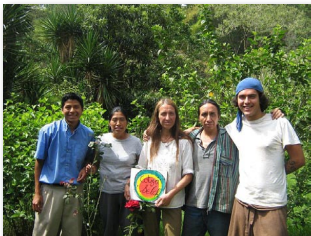
Toute l'équipe de Cotzaselch

C'est surtout le temps des bilans sur les actions effectuées en plein air pour les membres de la coopérative COTZASELCH . Ses projets ont encore une fois été appuyés par l'aide de 5 jeunes volontaires américains, canadiens et allemands, lors du second chantier de jeunes. Dans la continuité du premier, le chantier a été riche de résultats pragmatiques et a ancré encore un peu plus le travail de la coopérative dans le petit village de Tzajala.