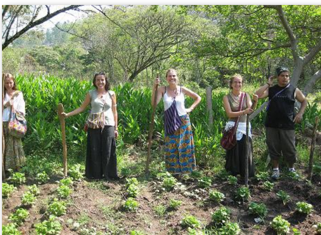
L'équipe prête pour la plantation de maïs

Ces activités permettront aux villageois intéressés de reproduire les techniques sur leurs propres terrains, et sont complétées dès aujourd'hui par une formation sur les différentes techniques de compostage. La coopérative se plaçant en appui technique et financier , le chantier a encore été l'occasion d'aider à préparer les jardins de 3 familles, à qui des graines ont ensuite été confiées.