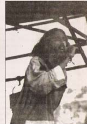
Vingt-cinq ans, débrillé, chevelu et désarmant d'humilité.