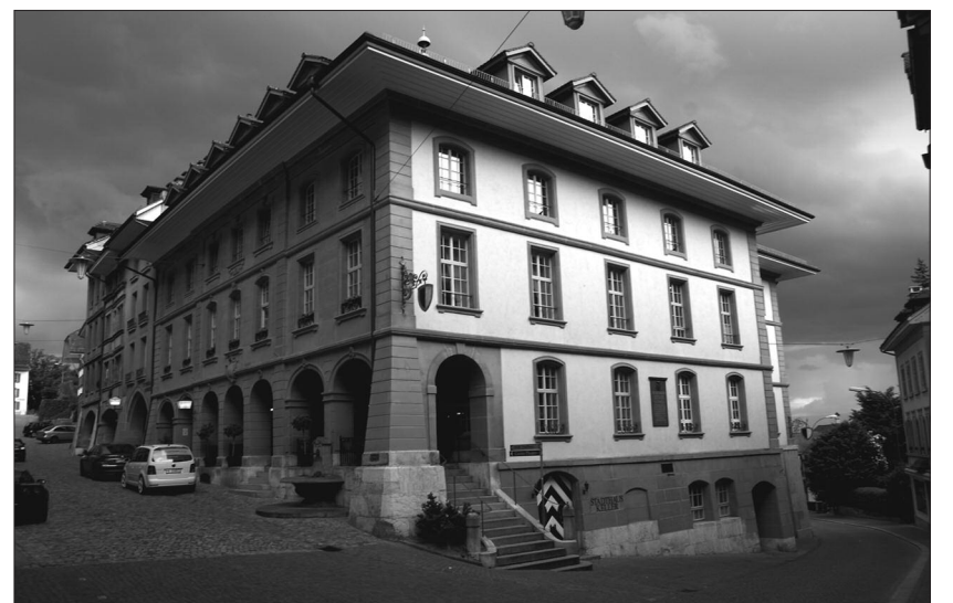
Das zum Konzertlokal umfunktionierte 4-Sterne-Hotel Stadthaus

ernsthaft gegen sein Rechtsextremismus-Problem vorgehen und lieber wie bisher alle Vorfälle unter den Teppich kehren. So kann nur gehofft werden, dass sich die EinwohnerInnen Burgdorfs der Lösung dieses Problems selber annehmen werden.