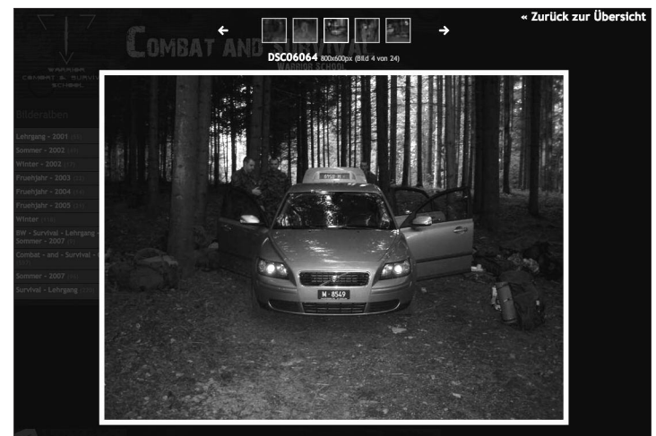
Schweizer Militärauto mit dem Kennzeichen M 8549

Die Durchführung von Trainingscamps durch externe Firmen, die von der Schweizer Armee ideell und wohl auch materiell unterstützt werden, ist gang und gäbe. Sie fungieren auf der Homepage des Departements für Verteidigung Bevölkerungsschutz und Sport (VBS). Auch die Tatsache, dass das Militär ein zunehmendes