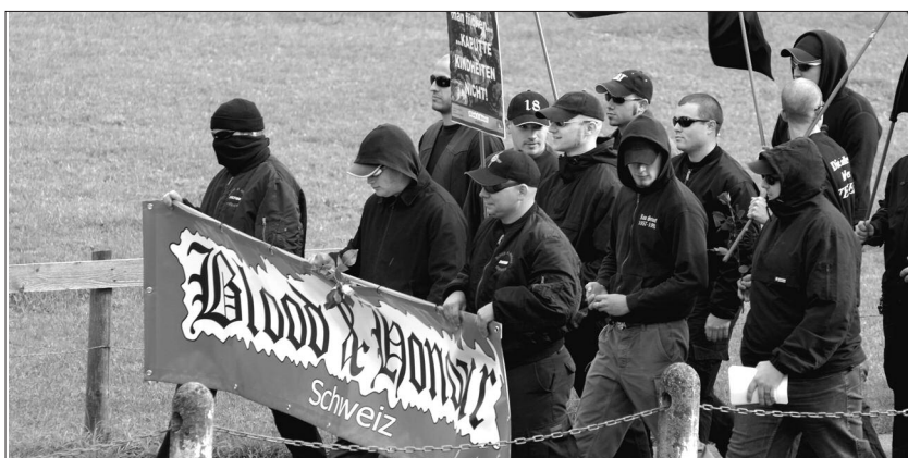
Neonazis im Autonomen-Look in Appenzell

Musikveranstaltungen bleiben ein zentrales Element der rechtsextremen Szene. An den bierseligen Konzerten wird die Propaganda unter die Leute gebracht und insbesondere auch das junge Publikum angesprochen. Kontakte können geknüpft und Freundschaften gepflegt werden. Umso bedenkllicher ist, dass etwa das von der PNOS organisierte Konzert in Wimmis BE vom 16. März 2008 in der Turnhalle einer Schulanlage stattfand oder der Auftritt von «Indiziert» am 22. Dezember im 4-Sterne-Hotel «Stadthaus» in der Burgdorfer Oberstadt. Behördenunfähigkeit par excellence, begnügt man sich doch jeweils mit den Zusagen der Veranstaltenden, dass alles ruhig über die Bühne gehen werde. Die Schweiz blieb auch 2007 ein Konzertparadies, es verging kaum ein Monat ohne hetzerisches Konzert.