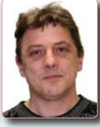
Fabrice CERBAI Maire de Knutange