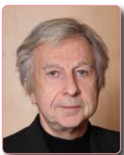
Jean-Pierre MASSERET Sénateur de la Moselle Président du Conseil Régional