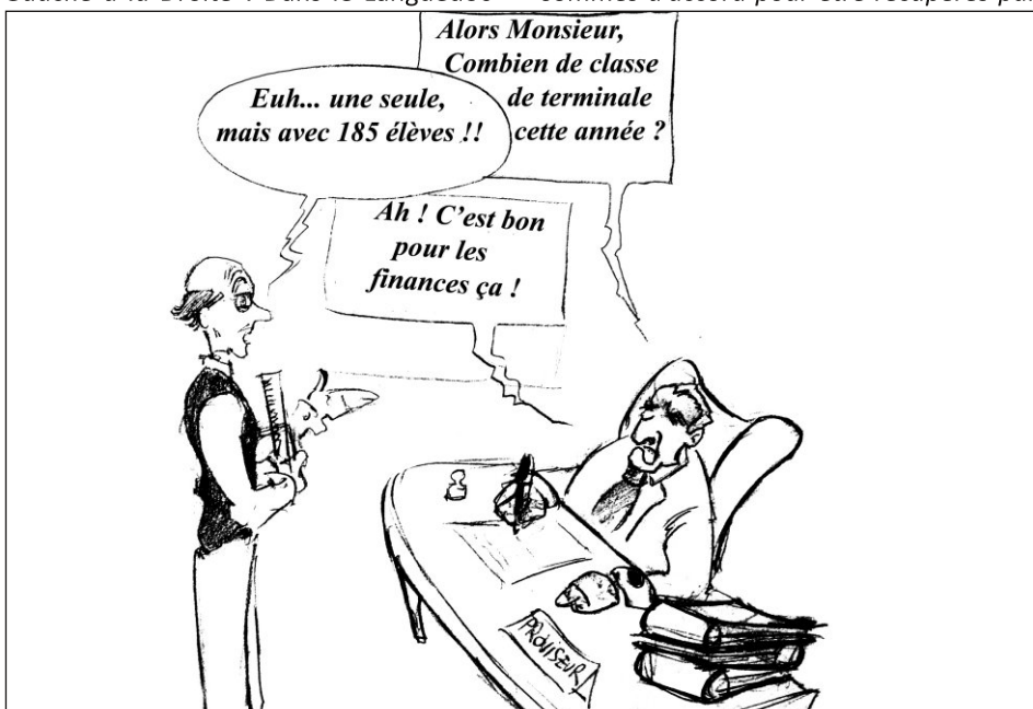
Illustration de Mathieu Mianny

Le pavé est lancé ! Mais le combat commence tout juste car il ne s'agit pas de gesticulations ou de bonnes intentions devant les caméras qui minent tant le débat politique dans notre pays. Ces régions, nous irons les chercher à la force de nos bras, dans les quartiers populaires où les hommes et les femmes ont perdu espoir, dans la rue où les gens défilent contre la politique de Sarkozy, dans les universités et les lycées alors que la Droite détruit notre système éducatif. Car ce ne sommes pas que des partisans ou des syndicalistes mais aussi de nombreux citoyens de Gauche, qui aspirent à un profond changement de notre société, qui font de ce rassemblement non plus seulement un Front de Gauche mais un véritable Front Populaire !