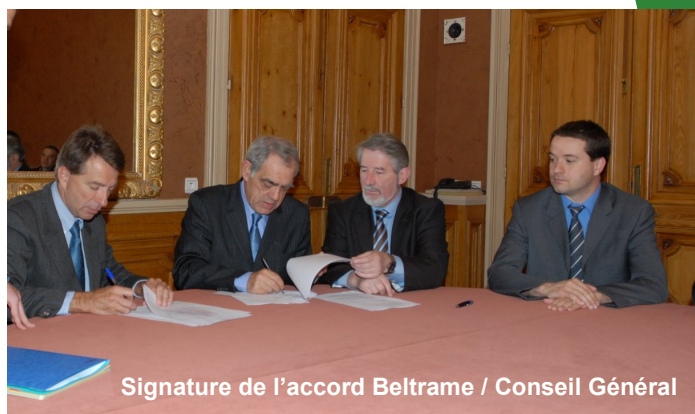
Signature de l'accord Beltrame / Conseil Général

Je veillerai à ce que les engagements de ces deux sociétés, en matière d'emplois et de protection de l'environnement soient respectés.