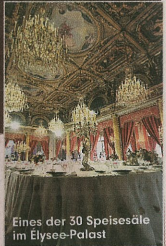
Eines der 30 Speisesäle im Élysée-Palast