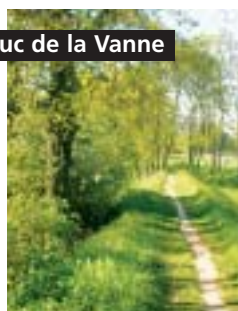
Aqueduc de la Vanne