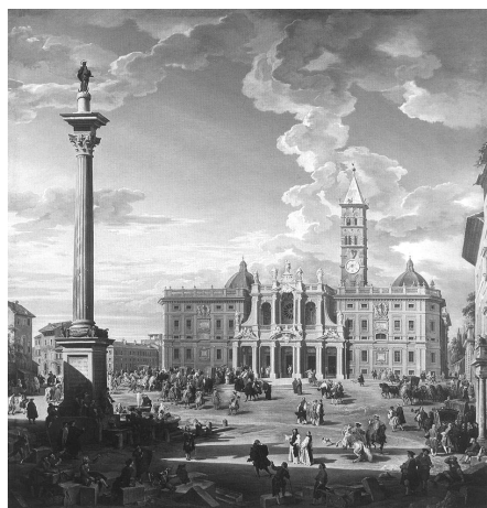
Basilique Sainte Marie Majeure Rome

Qu'elles sont les fêtes de la Vierge Marie durant l'année ?