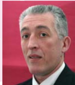
Christophe CELSO Photographeur Haie Griselle