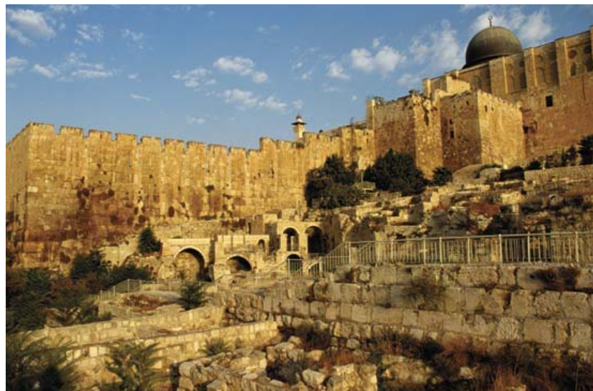
Le Temple de Jérusalem

Il existe plusieurs références bibliques au 4 ème mois, mais le nom de Tammouz n'apparaît dans la Bible que comme le nom d'une divinité mésopotamienne, connue chez les Syro-Phéniciens sous le nom de Adoni et chez les Grecs d'Adonis. Les Juifs qui revenaient en Judée de l'exil en Babylonie introduisirent le nom Tammouz comme nom de leur 4 ème mois et il revient fréquemment dans la littérature rabbinique. Dans la tradition, Tammouz marque le début de l'été en Israël.