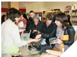
Viandes, charcuteries, fruits et légumes, produits laitiers... Plus de cinq cents références sont présentées dans les rayons du magasin.

« Ma Product'Yon locale » est un magasin né grâce à l'association de six producteurs vendéens. Ils ont eu l'idée de proposer en un seul lieu, au 13 rue d'Aizenay à La Roche-sur-Yon, un large panel de produits locaux. Ils travaillent en partenariat avec trente autres producteurs qui permettent d'élargir la gamme. L'objectif étant d'offrir aux clients de la marchandise de qualité et de proximité.