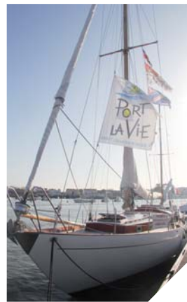
Le Rose noire II fêtera ses cinquante ans en 2014.

En 2014, pour ses cinquante ans, le Rose noire II se rendra à Nantes où il retrouvera un autre bateau de légende : le Belem.