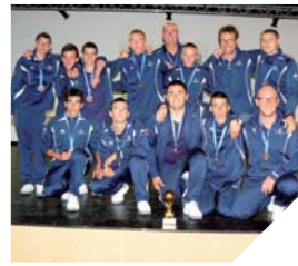
Les jeunes sportifs ont représenté la France et la Vendée en Suède, lors du tournoi international de football adapté.

Leur défi? Représenter leur département et leur pays hors frontières. Ils l'ont brillamment relevé en terminant à la troisième place du tournoi.