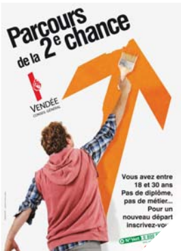
Le parcours de la seconde chance permet de former et d'orienter les jeunes vers des secteurs porteurs.

Sud Vendée: réunion d'information le 11 décembre à 10h à l'école des Etablissements-ISEME, route de la Châtaigneraie à Fontenay-le-Comte. Inscription obligatoire.