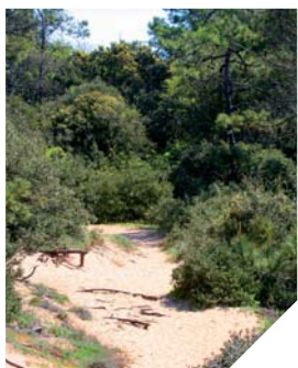
Les forêts domaniales du littoral font partie des richesses touristiques de la Vendée.

Le Département et l'Office National des Forêts ont décidé d'unir leurs efforts pour mieux protéger les forêts domaniales littorales de Vendée. Cinq grands thèmes sont particulièrement mis en avant dans ce partenariat: la préservation de la forêt, la biodiversité, l'accueil du public, la filière bois-énergie et aussi la communication.