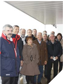
L'association Vendée Job Challenge est basée à la Maison départementale de l'emploi et du développement économique.

Renseignements: www.vendee-job-challenge.fr