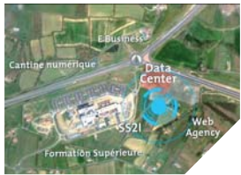
Première étape du pôle, l'arrivée d'un Data Center va permettre le développement de projets numériques sur le Pays des Olonnes.

sociation Entreprises des Olonnes, Vendée Expansion et la Chambre de Commerce et d'Industrie, ce pôle accueillera une première entreprise dès 2013. Une étape fondamentale pour tourner l'économie vendéenne vers demain (lire interview de Bruno Retailleau).