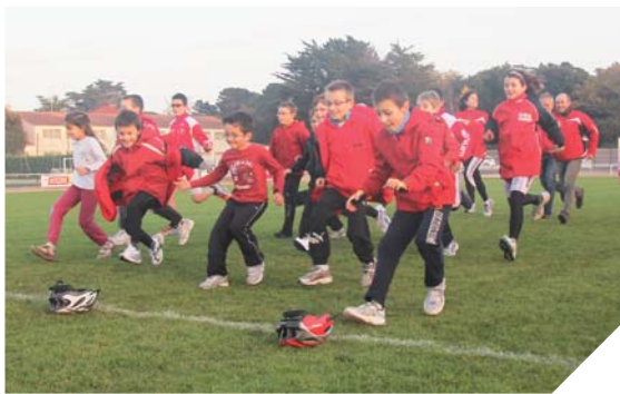
Les jeunes du club de l'île de Noirmoutier pratiquent un exercice de transition, de la course à pied au vélo.

À l'image de nombreux clubs de triathlon en Vendée, celui de Noirmoutier connaît un succès croissant. Plus de la moitié de la centaine de membres ont moins de 17 ans. Retour sur ce boom du triathlon en Vendée.