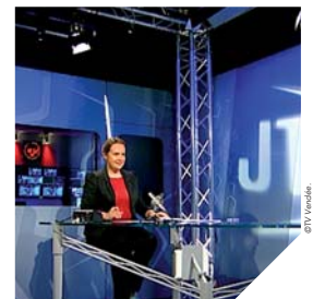
TV Vendée propose un point quotidien sur le Vendée Globe.

Après avoir été présent quotidiennement sur le village du Vendée Globe, TV Vendée est toujours au