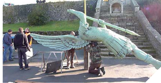
La statue de l'Archange Saint Michel terrassant le dragon va être démontée pièce par pièce pour une restauration complète.

«Un Archange de dix mètres de haut et 1 200 kg perché dans le ciel vendéen»