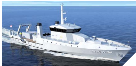
Ocea vient de signer un contrat avec la marine indonésienne pour deux unités de soixante mètres.

En France aussi, Ocea scrute les opportunités. Ainsi, le développement de l'éolien offshore intéresse l'entreprise qui propose déjà des bateaux pour les plateformes pétrolières. Actuellement, des bateaux sont testés pour une application dans l'éolien offshore. « Nous disposons d'un système innovant qui permet de donner au bateau une grande stabilité. Cela apporte du confort et de la sécurité pour le personnel, notamment lors des transferts en mer », ajoute Fabrice Epaud. Sur le site des Sables-d'Olonne, l'entreprise va également de l'avant avec une refonte complète du chantier. Premiers coups de pioche début 2013 pour de nouveaux chantiers 18 mois plus tard. Affaire à suivre!