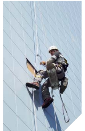
Bruno Linay travaille ici sur une façade d'immeuble. Il est descendu en rappel pour effectuer une réparation. Et éviter l'installation d'un échafaudage ou d'une grue par exemple.

Bruno Linay entre alors en scène: il s'équipe d'une corde et d'un casque de sécurité. En peu de temps, il trouve l'accès qui lui permet d'accéder au toit de l'édifice. Puis, il descend en rappel tout au long de la façade pour effectuer le service demandé.