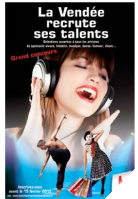
Vous voulez devenir chanteur, danseur, comédien ou musicien professionnel? Ce concours est pour vous!

Renseignements: Inscriptions avant le 15 février 2013 sur: www.lavendee recrutesestalents.fr