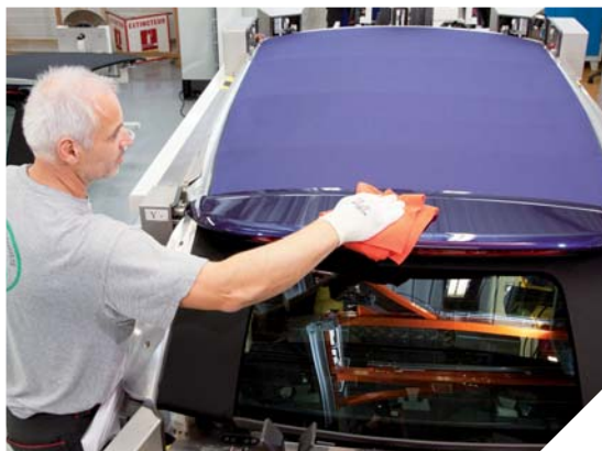
Le fournisseur Webasto est leader mondial des systèmes de toits de voiture. Le site des Châtelliers-Châteaumur a été distingué dernièrement par PSA Peugeot-Citroën.

Webasto est leader mondial des systèmes de toits de voiture. Le site vendéen basé aux Châtelliers-Châteaumur a été distingué. PSA Peugeot-Citroën, reconnaît le rayonnement mondial de l'entreprise vendéenne. Il la nomme « fournisseur majeur ».