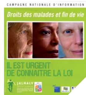
La loi Leonetti, en vigueur depuis 2005 en France, est le gage du respect des personnes en fin de vie. De nombreux pays s'en inspirent.

Des soins pluri-disciplinaires dont l'une des priorités se trouve dans le respect inconditionnel de