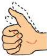
Arrêt ou reprise du chronomètre