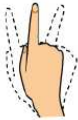
Invalidé ou non autorisé