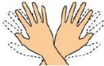
Fin de la période