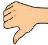
Balle à terre ou entre-deux