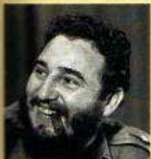
Fidel Castro, dirigeant communiste de Cuba de 1959 à nos jours