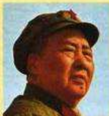
Mao Zedong, dirigeant de la République populaire de Chine de 1949 à 1976