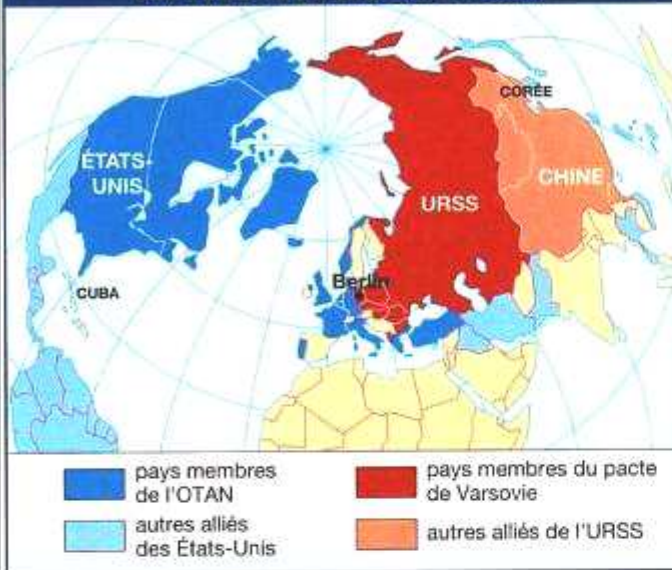
EN 1955 : DES BLOCS OPPOSÉS