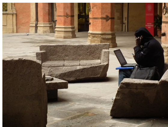
Accessibilité du web pour tous et couverture en wifi intégrale

L'intérêt transversal des TIC (télémédecine, formation à distance, attractivité des territoires, E-gouvernance) était bien représenté dans la délégation qui a veillé à être représentative de l'Auvergne. Le groupe se composait de techniciens de collectivités, d'élus, d'agricultrices, d'associations, d'un médecin et d'une enseignante universitaire.