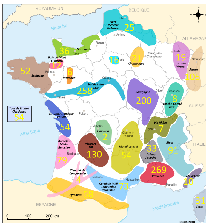
Programmation des tours opérateurs spécialisés dans les séjours à vélo (Nombre de circuits par destination)

La découverte plus lente engendre une attention plus grande portée aux paysages, aux terroirs, à la rencontre. Les touristes à vélos sont de grands consommateurs de patrimoine: visite de musées, d'expositions, de monuments, de sites historiques, d'espaces naturels remarquables, découverte de la gastronomie, et de l'oenologie. Par exemple, sur la Loire à vélo, plus d'un tiers des cyclistes visitent des sites touristiques, pour une moyenne de deux sites visités dans la journée, avant tout des châteaux (40%) (source région Centre). De nombreux tours opérateurs présentent leur catalogue sous l'angle patrimoine naturel et culturel. (Nicolas Mercat, Revue Espaces, 2010 et DGCIS- Article du 18 mars 2010, Sébastien Baholet)