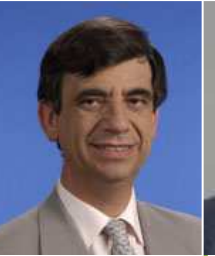
Serge ROQUES Pays Rouergue Occidental Maire de Villefranche