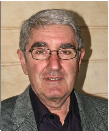
Michel DELPECH Figeac Communauté Maire de Marclillac sur Célé