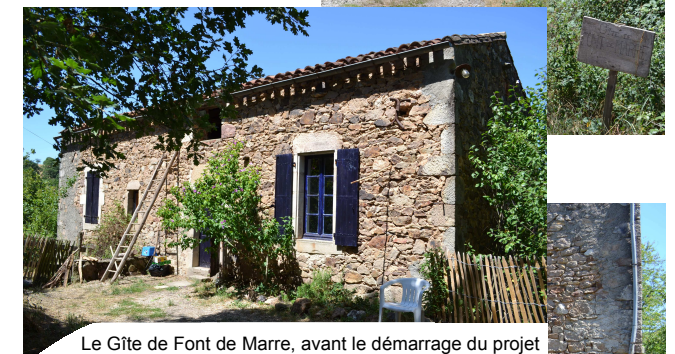
Le Gîte de Font de Marre, avant le démarrage du projet

En 1992, par le biais d'un Plan d'Amélioration Matérielle (PAM) d'importants travaux de rénovation des bâtiments autour du corps de ferme, en vue de la diversification vers des activités plus touristiques, ont pu être réalisés. Des gîtes de groupe, également loués pour des familles et un espace de camping aménagé ont permis à la ferme de devenir le premier site de tourisme rural du territoire à proposer également des activités équestres ; elle est labellisée Centre de Tourisme Equestre à la Fédération Française