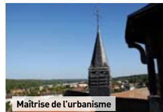
Maîtrise de l'urbanisme