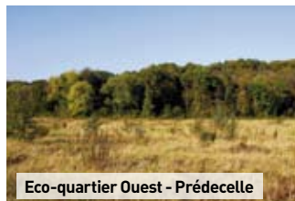
Eco-quartier Ouest - Prédécelle