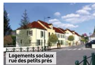
Logements sociaux rue des petits prés