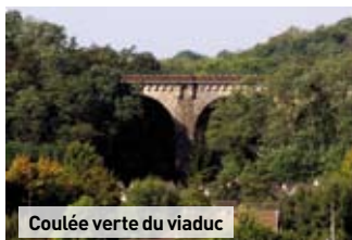
Coulée verte du viaduc