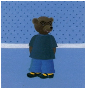
Viens te laver les mains. Non, elles sont pas sales, mes mains !