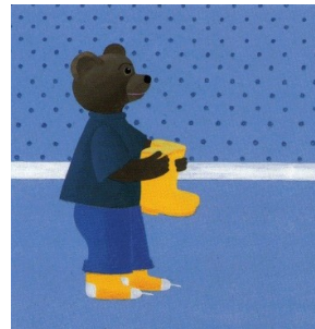
Viens mettre tes chaussures. Non, pas mes chaussures, mes bottes !