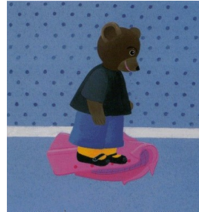
Petit ours brun, va chercher ton manteau. Non, pas mon manteau, il n'est pas joli.