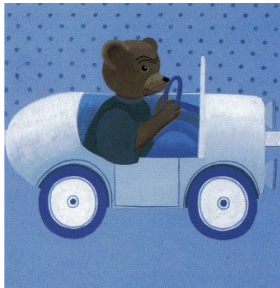
Petit ours brun, j'ai dit de ranger. Non, je suis dans ma voiture.