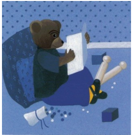
Petit ours brun, il faut ranger, dit maman. Non, je n'ai pas fini