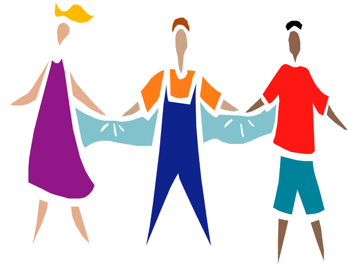
Image à colorier « Tu dessines un bonhomme qui donne la main à la dame pour qu'ils soient ensemble »