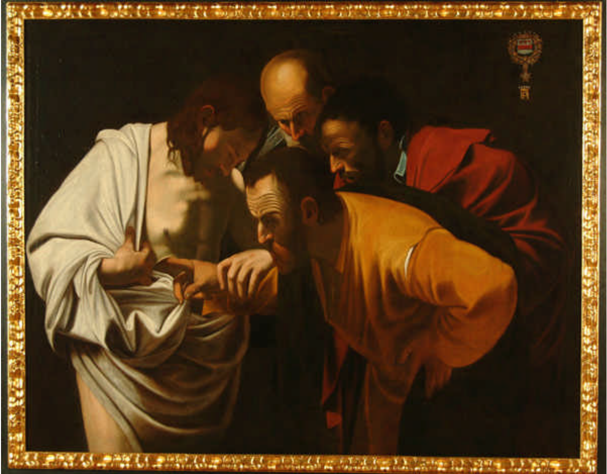
L'incrédulité de Saint-Thomas