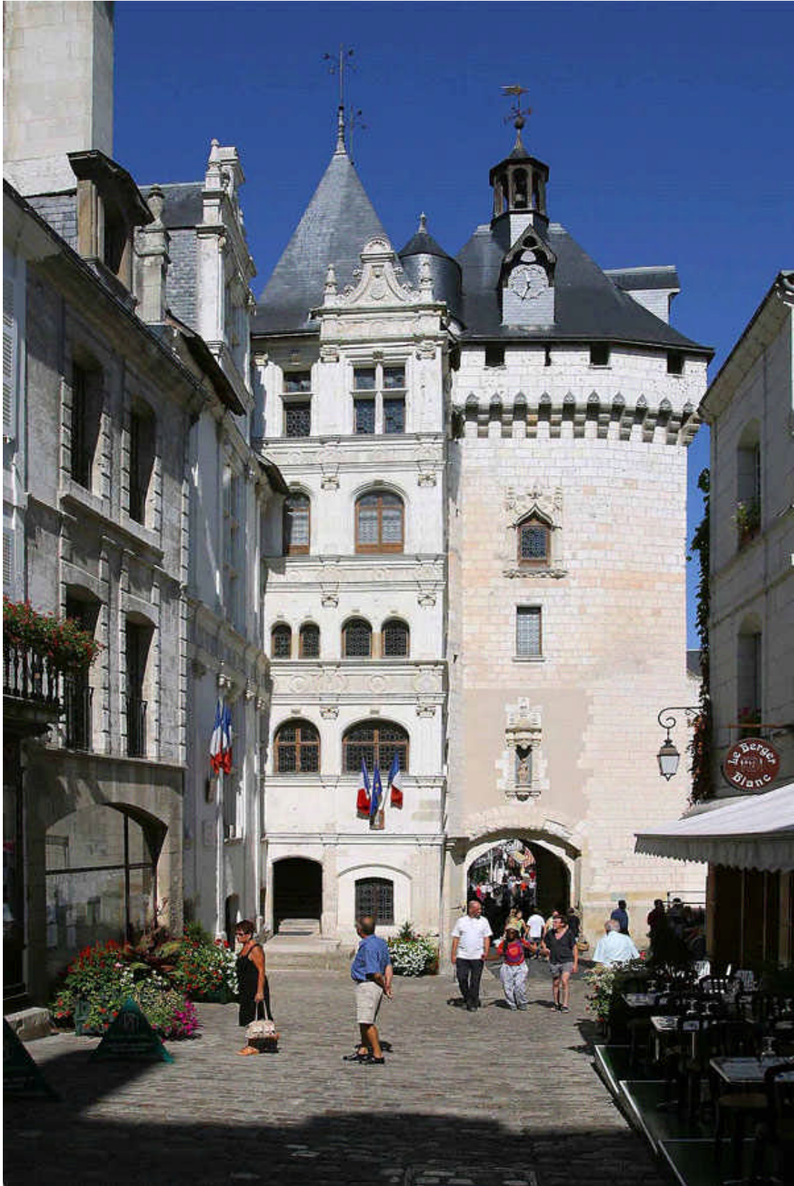
L'Hôtel de Ville Renaissance