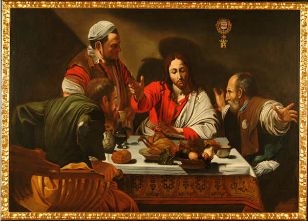
La Cène à Emmaüs