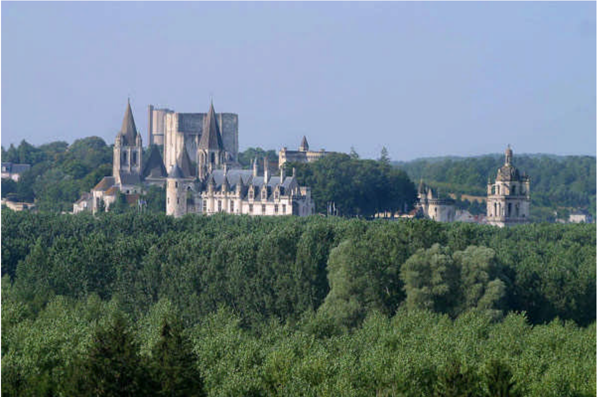
Loches dans son écrin de verdure