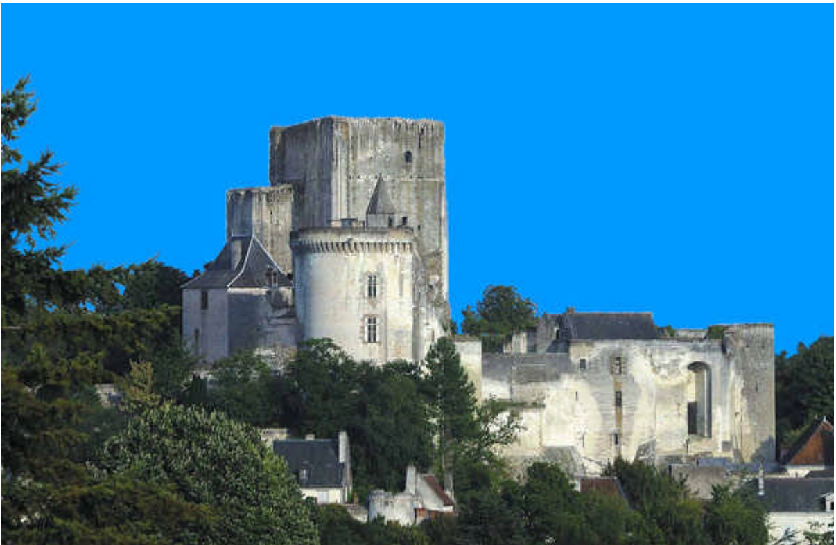
Le Donjon au cœur de la cité médiévale