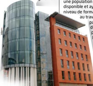
Novaxis : pôle tertiaire international au sein de la gare TGV

L'Institut européen d'acoustique s'appuie sur la présence au Mans du 1 er laboratoire acoustique de France, 1 er pôle de formation français dans cette matière.