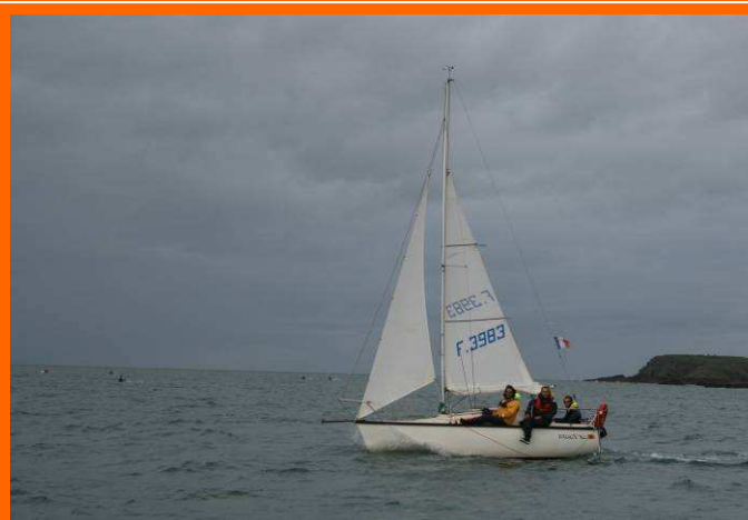
Virus sur le retour (voiles réduites)