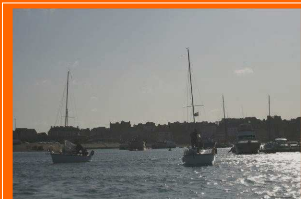
Virus et Elinoa

10h30 - Tous le monde est la, c'est parti pour les Hébiens !!