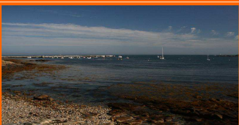
Gwen Ha Du à Molène – Été 2008

Enfin merci à tous les participants qui nous ont permis de passer une journée exceptionnelle ce samedi 06 Septembre 2008.