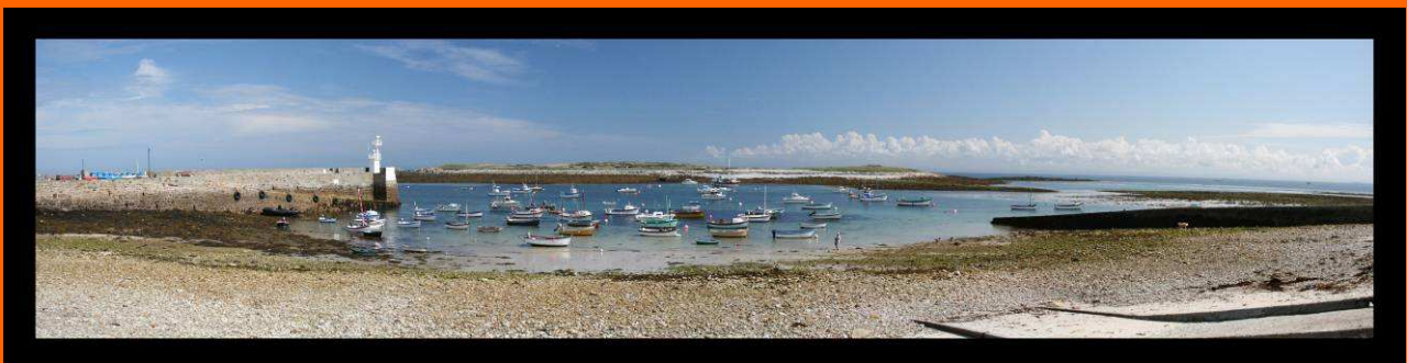
Molène en « Gwen Ha Du » - Eté 2008

Et c'est parti pour le "Grand rassemblement des 30 ans du First 18".