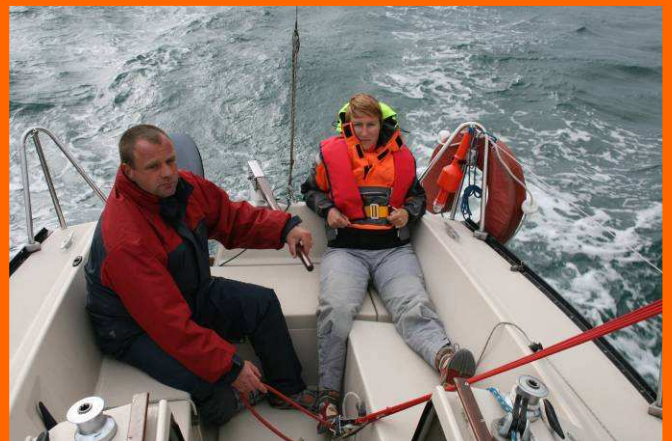
Mes équipiers au portant

19h - Nous débutons un nouveau genre d'apéritif : « l'Apéromatage » !!! Pendant que certains refont la journée, une équipe s'occupe de mater "Elinoa" dont la casse est vraiment minime !!