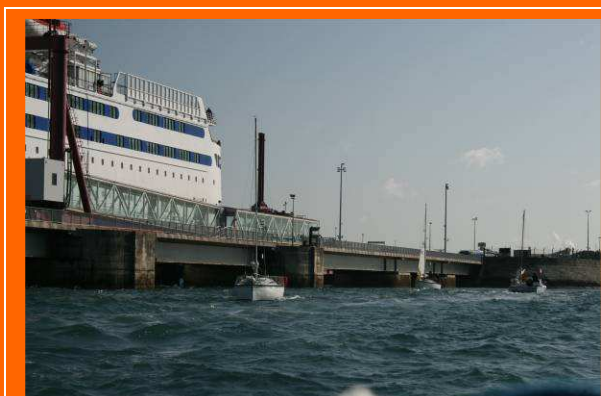
Elinoa et Virus

10h45 - Mince, il manque déjà un bateau, nous le voyons faire demi tour et rentrer au port, nous pensons que c'est "Antioche", il fait le bon choix avec 4 équipiers plus ou moins jeunes, il ne sert à rien de prendre des risques.