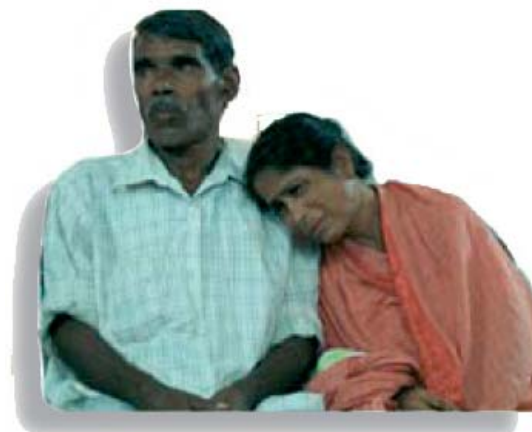
Couple chrétien du Bangladesh

Des fondamentalistes musulmans installés dans le village de Lokmanpur, dans le district de Gaibandha, ont menacé de tuer un pasteur. Ils ont déjà démolé le muret de clôture d'un terrain acheté en janvier par l'église pour y construire un temple. Des musulmans ont secrètement déposé une plainte pour réclamer cette terre dans un ultime effort pour empêcher l'Eglise d'entrer dans le village.