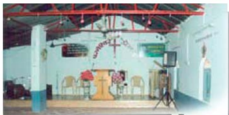
Intérieur de l'église Masihi Mandir

Le 1er juin, un groupe d'extrémistes hindous a interrompu le culte du dimanche matin à l'église Masihi Mandir de Durg, village de l'Etat de Chhatisgarh. Portes Ouvertes est entré en contact avec le pasteur, et l'a assuré de ses prières et de son aide.