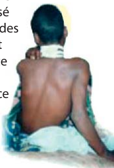
L'un des chrétiens nensebo blessé

Le 26 mars, un tribunal éthiopien a, en secret, condamné 3 musulmans à la prison à perpétuité. En effet, ils ont attaqué à la machette deux églises situées dans le village de Nensebo Chebi. Les faits se sont déroulés le 2 mars, les 3 hommes ont tué une personne et en ont blessé 17 autres. Les membres des familles des victimes ont été avertis que l'audience aurait lieu le 25 avril. Ils n'ont pris connaissance de la condamnation qu'une fois leur droit d'appel expiré.