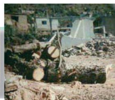
Leurs maisons ont été détruites