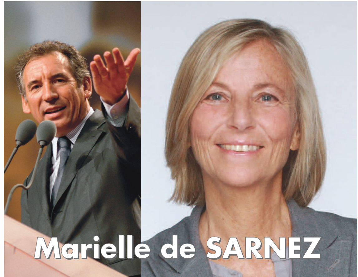
Marielle de SARNEZ