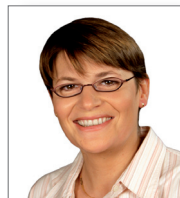
11 - Aude Luquet Conseillère régionale d'Ile-de-France, Seine-et-Marne .