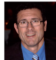
10 - Stéphane Traineau Ancien champion du monde de judo, Val-de-Marne .