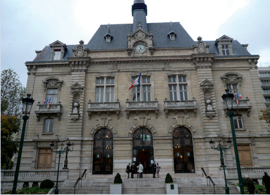
La mairie de Colombes