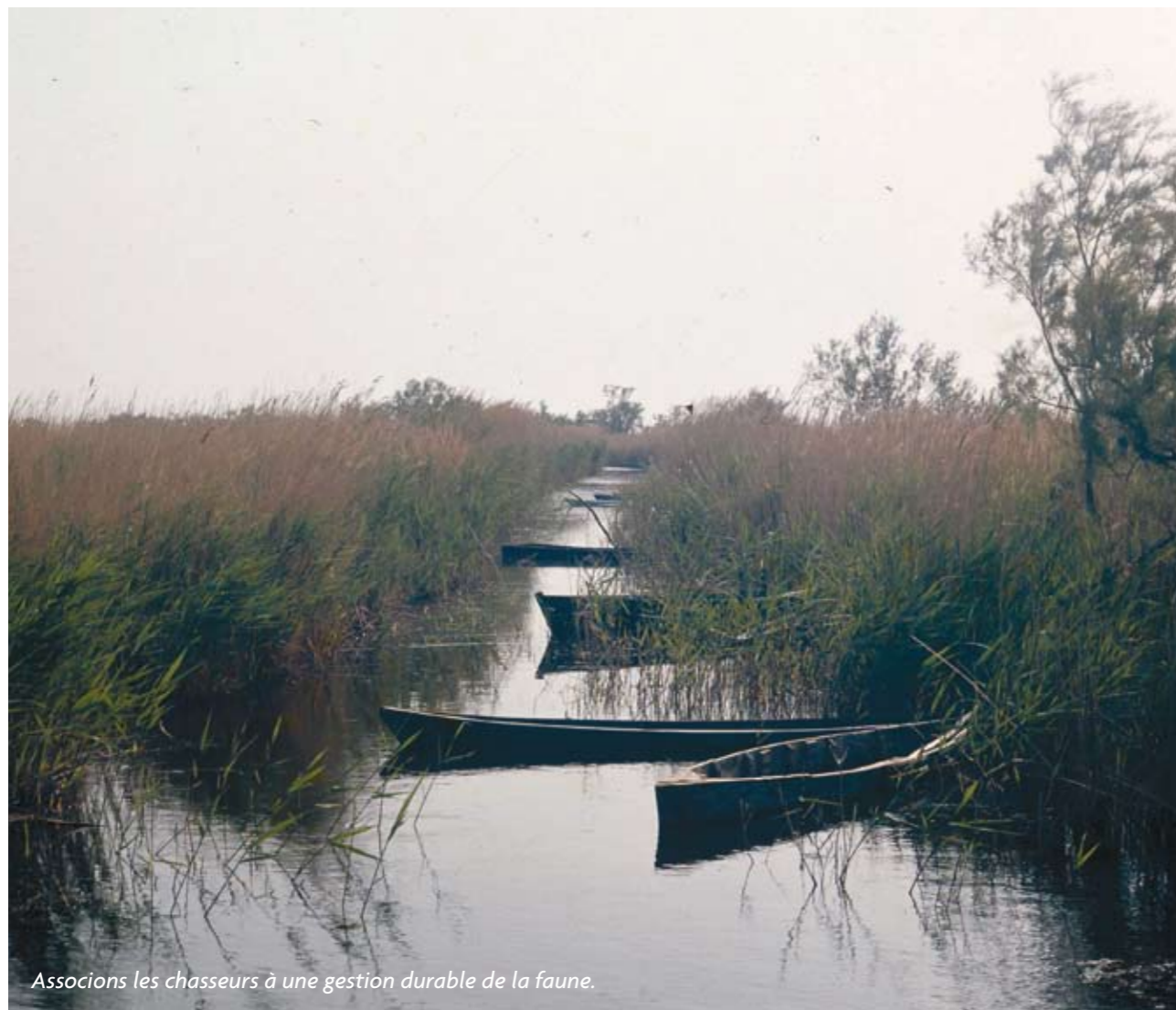
Associations chasseurs à une gestion durable de la faune.