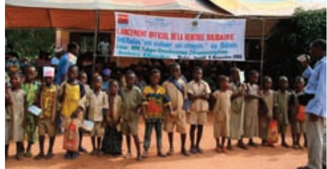
Remise de fournitures au Bénin - Collecte 2008