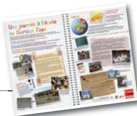
« Un cahier, un crayon »