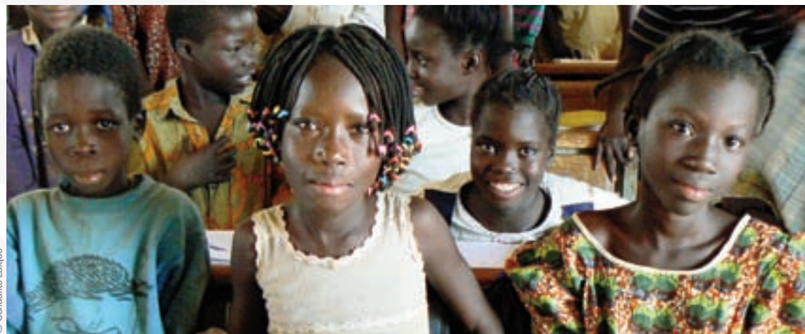
Écoliers du Burkina Faso

Du 23 octobre au 1 er novembre 2009 a eu lieu le Tour cycliste du Burkina Faso. Afin de préparer l'évènement au mieux, quatre coureurs cyclistes burkinabés se sont entraînés dans l'Eure-et-Loir. Ils ont été les invités d'honneur des élèves de 5 ème du collège Albert Sidoisne de Bonneval qui participaient à l'opération « Un cahier, un crayon » pour le Burkina Faso. Une rencontre interculturelle placée sous le signe de l'éducation qui a été l'opportunité d'en apprendre plus sur les réalités de ce pays en réalisant des interviews retranscrites par la suite sous la forme d'un article diffusé auprès des autres collégiens, une véritable action de sensibilisation et d'échanges.