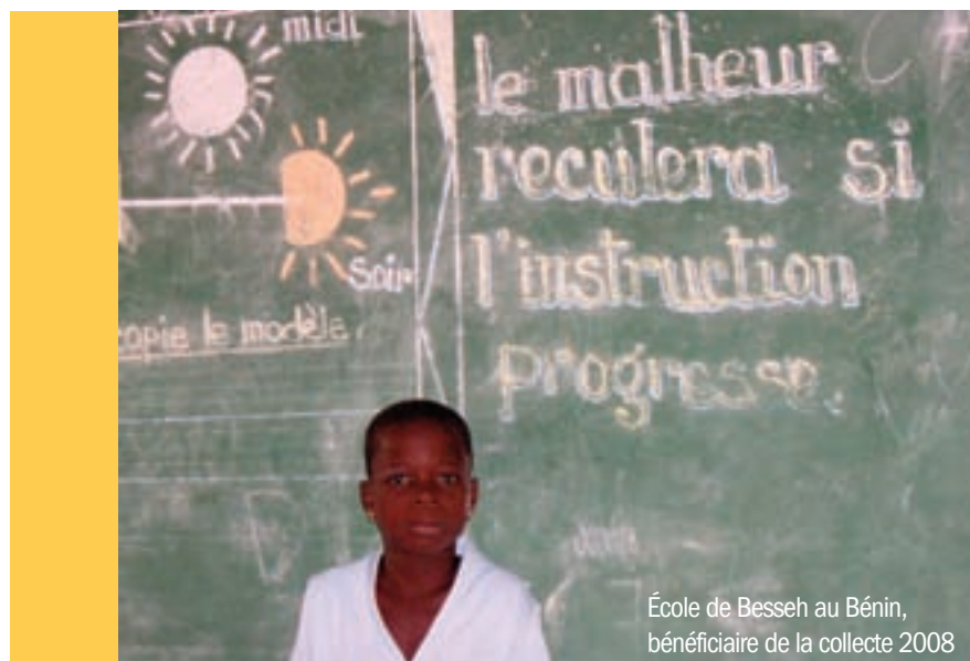
École de Besseh au Bénin, bénéficiaire de la collecte 2008

Pour nous, association au service de l'éducation, donner à cette action ponctuelle - la collecte - un réel sens pédagogique et l'ancrer dans une réflexion plus large et à plus long terme est primordial pour dépasser avec les jeunes la dimension purement affective du don. Leur « don » individuel s'insère globalement dans une action collective d'aide au développement par l'éducation, comme l'élève apprend à se situer dans la communauté éducative, le jeune dans sa ville, le futur citoyen dans la société. C'est ainsi que la Rentrée solidaire, à travers l'action, permet une activité pédagogique : celle d'apprendre concrètement la solidarité.