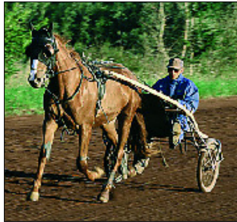
Un symposium européen sur les sciences équines se tiendra en octobre prochain.

Ces trois commissions sont chargées de faire des propositions qui seront par la suite présentées et étudiées par le comité de pilotage qui s'est constitué et composé de l'ensemble des acteurs : comités départementaux de tourisme équestre du Puy-de-Dôme et de l'Allier, DRAF, centres équestres, Comité régional d'équitation, Conseil du cheval, société des courses... Deux séries de réunion ont été organisées et ont permis aux