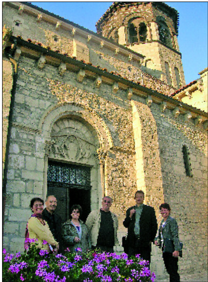
Le bureau du conseil de développement en réunion à Thuret.

Les actions actuellement à l'étude : • Mise en ligne et exploitation cartographique des données de