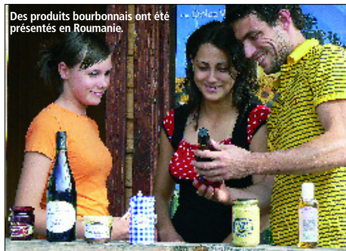
Des produits bouronnais ont été présentés en Roumanie.

► Un projet de coopération transnationale a été engagé entre le Pays Vichy-Auvergne et la Microrégion de Huedin (département de Cluj, Transylvanie), territoire pré-sélectionné dans le cadre du programme Leader en Roumanie. Des opérations sont en cours entre les deux territoires. Une dégustation de produits locaux du Pays Vichy-Auvergne sur Cluj en lien avec le Comité Départemental de Produits de l'Allier et le Centre Culturel Français de Cluj s'est déroulée le 02 avril dernier, parmi les invités de cette dégustation : le directeur général Cora Cluj et le plus grand importateur de vin de Cluj. Dès cet été, l'opération d'échanges « Eco-citoyens et identité européenne » sera lancée (lire l'annonce ci-contre). Elle vise la réalisation de séjours à thème autour de l'environnement avec des adolescents du Pays Vichy-Auvergne